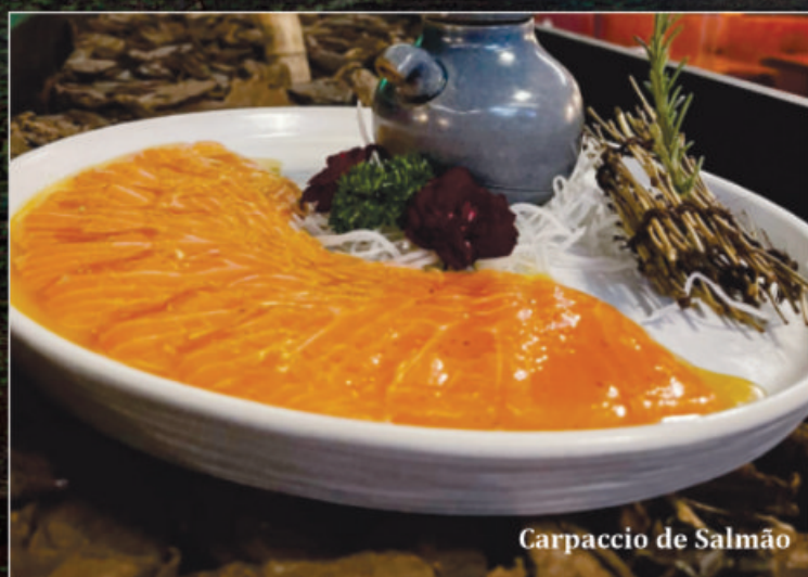
Carpaccio de Salmão