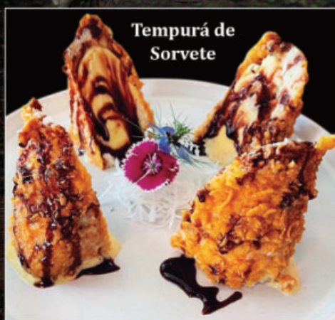
Tempurá de Sorvete